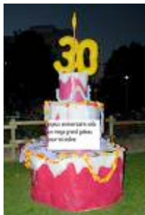
Agnès et Barberine

J-8, nous sommes prêts ! Bloquez vos agendas du 12 septembre au 19 octobre ! La photo et les arts plastiques ouvrent le ban le 11 septembre. Talonnés par les spectacles vivants du festival - du 11 au 14 septembre - lequel à peine fini, laissera la place aux journées du Patrimoine, du - 19 au 21 septembre - . And last but not least, les images pimentées du festival Courts Devant et Rififi - du 17 au 19 octobre - . Soit une centaine d'événements sur plus de quarante sites entre les Batignolles, les Epinettes et les Grandes Carrières ! Demandez le programme ! Au bureau du festival, sur nos permanences et chez nos complices commerçants ! Cette batinette, déjà la trentième ! vous en dit plus !